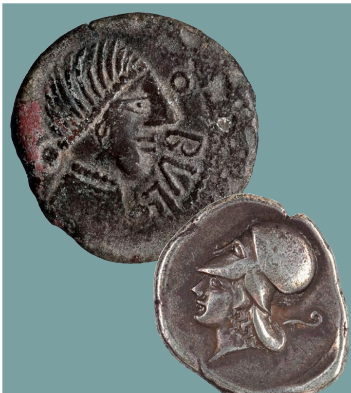
Unitat d'Obulco, mitjans segle II aC i Estatera de Corint, Segle IV aC Gabinet Numismàtic de Catalunya del Museu Nacional d'Art de Catalunya, Barcelona