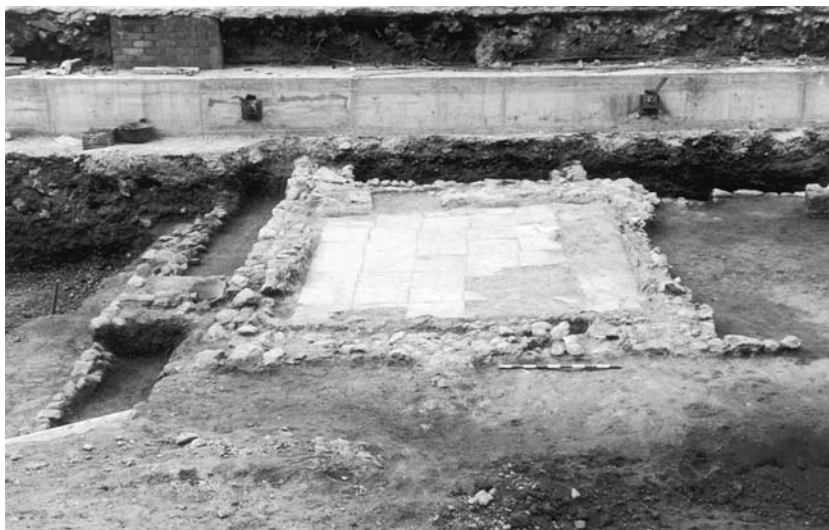
Figura 2. Bassa de decantació d'argiles del sector industrial julioclaudi.