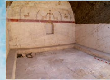
Sala capitular del complex monàstic.