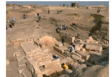
Vista general de la tomba saïta número 14, la més gran desenterrada avui dia.