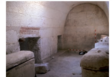
Interior de la tomba saïta número 1, una de les més antigues de la necròpolis.

L'empremta dels orígens de la ciutat s'ha conservat a les tombes saïtes de la Necròpolis Alta que van ser admirades i imitades en èpoques successives.