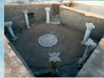
Capella dedicada al culte martiriàl.

La realitat econòmica i social de la ciutat bizantina es troba condensada en el domini fortificat del suburbi.