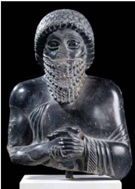
Fragment de l'estàtua d'Ur-Ningirsu Adquisició 1926, ca. 2100 aC. Diorita. 17,5 x 12,5 x 7,5 cm (sense base). Vorderasiatisches Museum, Staatliche Museen zu Berlin, VA 08790.

Així, Grècia i la Bíblia, fonts de la cultura europea i de l'Àsia occidental, no s'entenen sense Mesopotàmia. La història comença a Sumer?