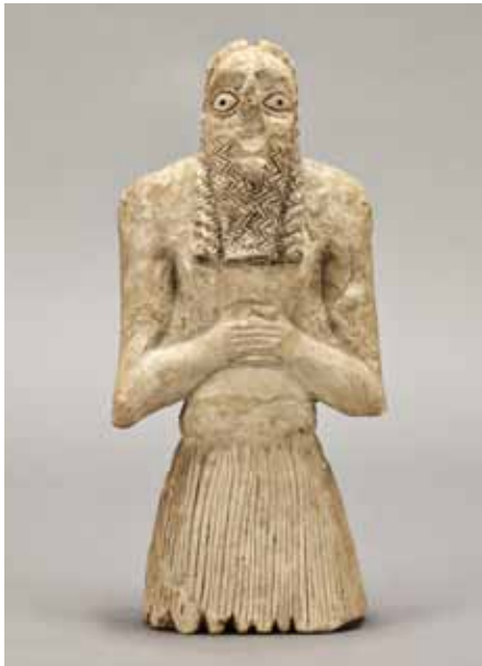
Estàtua masculina dempeus Khafaje (Iraq), temple de Nintu, nivell V. Període dinàstic arcaic II, 2650-2550 aC. Calcita o guix, amb incrustacions de petxina i massilla de betum. 26 x 12 x 6,5 cm. Expedició conjunta a Mesopotàmia, 1936-1937. Núm. de camp KH8-265. Penn Museum, Filadèlfia, 37-15-34.