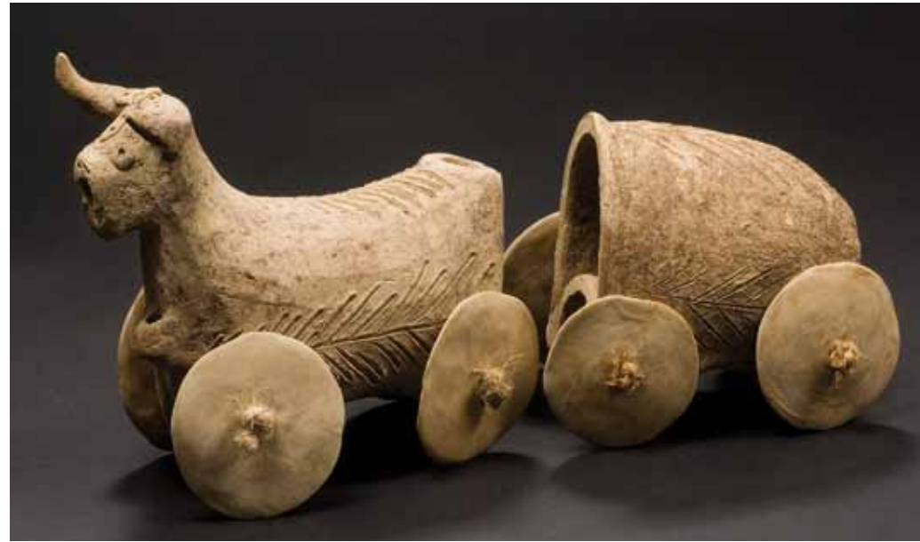
Toro sobre rodes i carro envelat III mil·lenni. Terracota. 10,3 x 9,3 x 6,9 cm; 14,8 x 12,5 x 6 cm. Musées royaux d'Art et d'Histoire, Brussel·les, O.3761, O.3760.