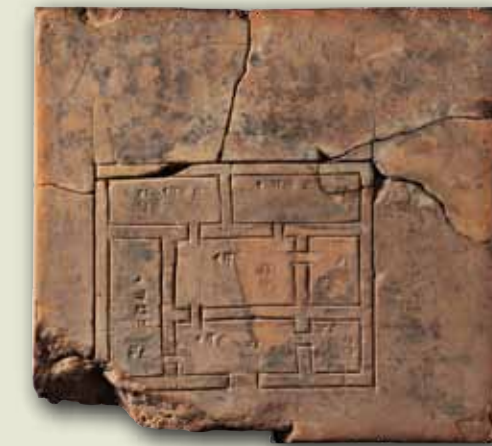
Plànol d'una casa

Adquisició sense datar, ca. 2000 aC. Ceràmica. 11,4 x 12,2 x 2,6 cm. Vorderasiatisches Museum, Staatliche Museen zu Berlin, VAT 07031